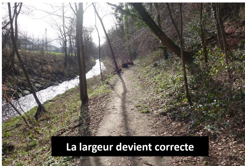
La largeur devient correcte