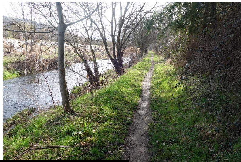
Entre la rue de la gare et le site Äkers (rive gauche)