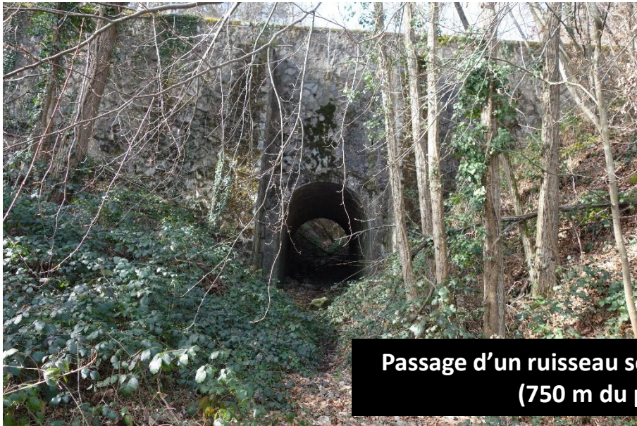
Passage d'un ruisseau sous la voie du chemin de fer (750 m du pont de Boiron)