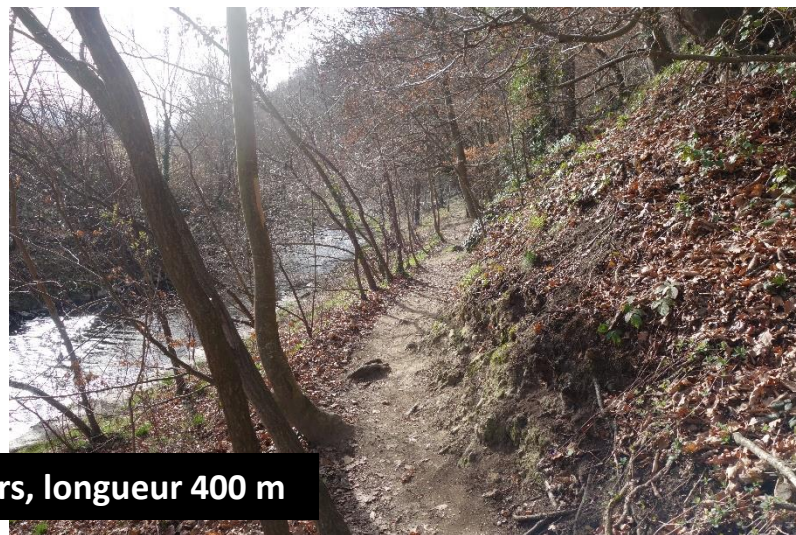
Passages étroits et en dévers, longueur 400 m