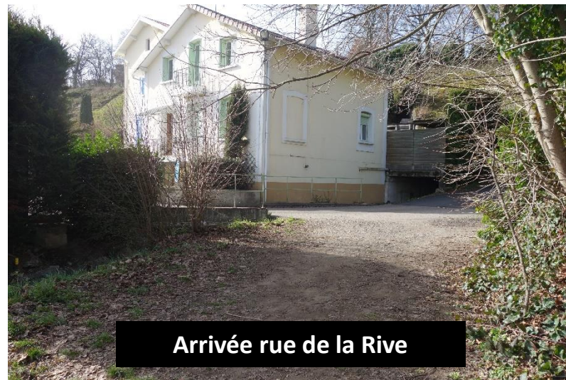
Arrivée rue de la Rive