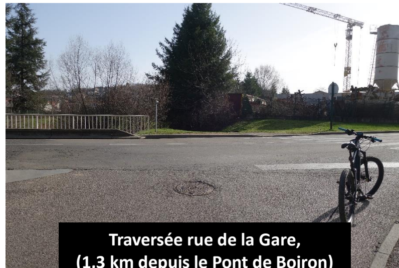
Traversée rue de la Gare, (1,3 km depuis le Pont de Boiron)