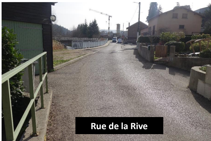
Rue de la Rive