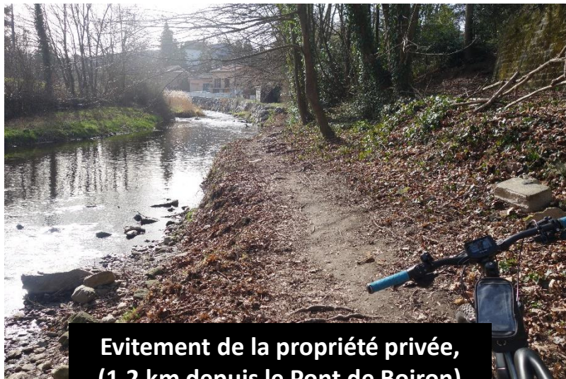
Evitement de la propriété privée, (1,2 km depuis le Pont de Boiron)