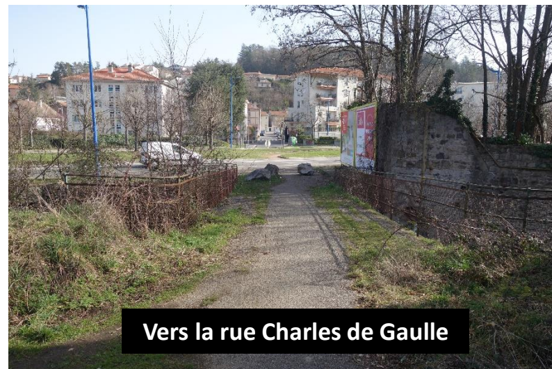
Vers la rue Charles de Gaulle